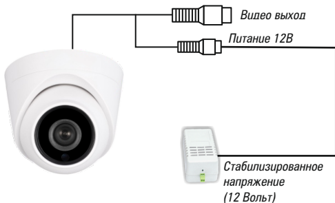
Рис.1 Схема подключения