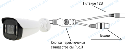
Рис.1 Схема подключения